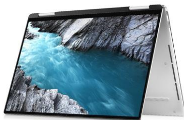
Режим тип „палатка“